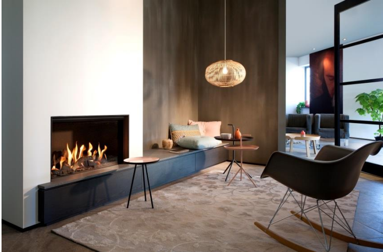
Fairo ECO-line 80, frontal

Komfortabel, umweltfreundlich, anpassungsfähig, energiesparend: das Programm ECO-line von Kal-fire bietet vielfältige, sehr überzeugende Vorteile, die sicherlich auch dem härtesten Gasenergie-Skeptiker gefallen werden!