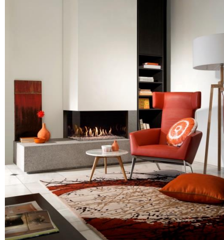
Fairo ECO-line 85, Eckmodell, linksstehend

Die Vorteile eines Gasfeuers – ein echtes Kaminfeuer ohne die Sorgen von Holzbeschaffung und Ofenreinigung – werden von immer mehr Menschen geschätzt. Ein einfacher Knopfdruck genügt und schon lodern die Flammen auf, züngeln im Kamin und heizen den Wohnraum im Handumdrehen. Hinzu kommt, dass die Brenndauer präzise eingestellt werden und sich so jedem Lebensrhythmus anpassen lässt.