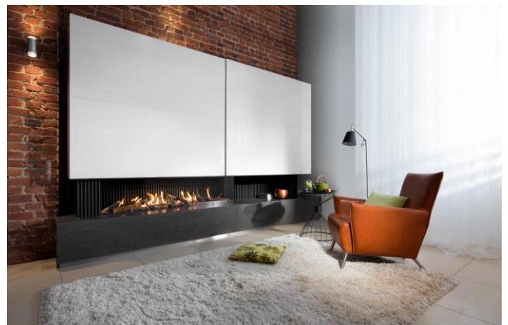
Fairo ECO-line 165, Eckmodell