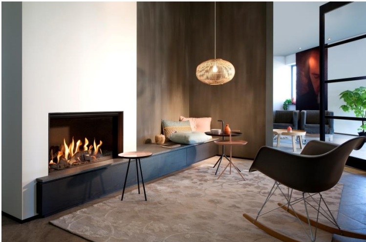
Fairo ECO-line 80.jpg

Confort, respect de l'environnement, adaptabilité, économies d'énergie : la gamme Fairo ECO-line de Kal-fire offre de multiples atouts très convaincants, qui sauront certainement séduire les esprits les plus réfractaires à l'énergie gaz !